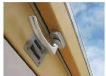
La maniglia oltre alla chiusura totale, permette la ventilazione in posizione di sicurezza.