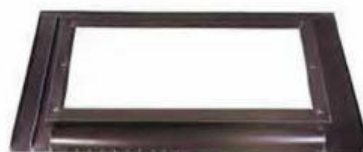
Finestra per tetti con raccordo pre-assemblato