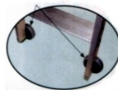
Coppia di ruote per spostamento laterale